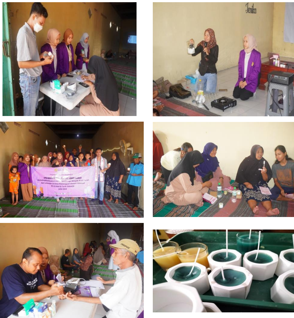
Gambar 1. Dokumentasi Kegiatan Pengabdian di Desa Klanting sari Dusun Wonosari RT 07/RW 02 Sidoarjo