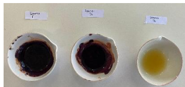
Gambar 1. Analisis identifikasi warni dengan mengungnakan FeCl 3

Uji kualitatif melalui metode identifikasi warna merupakan uji pertama yang dilakukan dalam penelitian ini untuk menentukan apakah krim malam dalam sampel yang dipilih mengandung hidrokuinon atau tidak. Tujuan identifikasi adalah untuk mengenali gugus fungsi spesifik dengan adanya dalam suatu senyawanya lewat reaksi kimia dengan spesifik yakni reaksi kimia dengan hanya bereaksi dengan gugus fungsi lain (18)